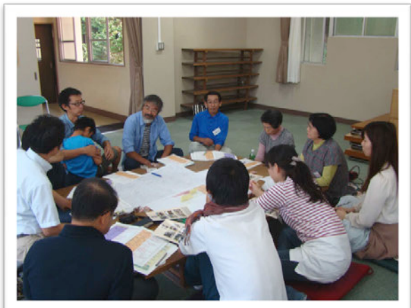
みんなで輪になって想いを出し合いました

九月二十七日(日)に旧千万町小学校で、《十年後の千万町・木下》のことを考える「ふるさとづくりワークショップ」の第一回が開催されました。 子どもたちや最近移住した方、古くから住んでいる方など多様な三十人も人が集まり、グループにわかれ、8年前に作られた「地域活性化ビジョン」が今どのような状況か、大切にしたいものは何かなどについて、話し合いました。