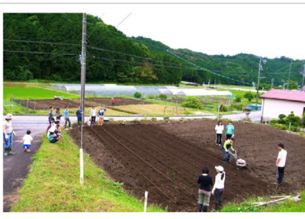
最初にお借りした通称【ハビ園】初年度の様子

千万町・木下の皆さん、いつも お世話になってます。 HAPPYPUNCH(ハッピーパン チ)です。