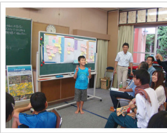
子どもたちの意見に大人一同ハッとされる場面も。

「茅葺屋敷がなくなってしまい、出かける場所が減ってしまい、やりがいもなくなってしまった」という最近の変化についての意見。「子どもの数は減っているが、まちの人たちが子どもをみてくれてみんなで子育てしている感じがする」「活性化も大事だが暮らす視点も大事」という全般にわたる意見。「都会っぽくしたくない。山と川があれば遊べる」「お父さんの仕事をお兄ちゃんと一緒にやりたいなあ」「バーみたいな飲めるところが欲しいな」といった率直な意見も聞かれました。